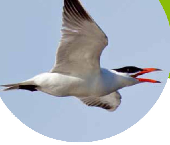
Reuzenster op steeds meer plaatsen gezien. Meers (Li), 30 april 2012.